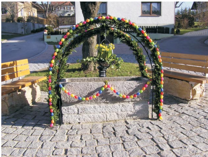
Bild: Osterbrunnen im Ortsteil Rohrbach

Osterschmuck gestaltet von Rohrbacher Bürgern