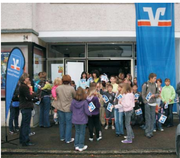
In Zusammenarbeit mit der Raiffeisen-Volksbank Neuburg e.G. und Kinobesitzer Fritz Appel fand im Rahmen des Ferienprogrammes ein Kinotag statt. Mehr als 130 Kinder konnten mit dem Film „toy story 3“ eine spannende und unterhaltsame Zeit verbringen.