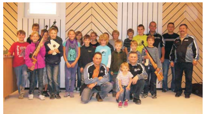
Genau 1 Jahr nach Baubeginn konnten über 20 Kinder und Jugendliche am 5. September bereits in den neuen Räumen der Schützengemeinschaft Trugenhofen am Schnupperkurs teilnehmen. Jeder Teilnehmer erhielt eine Urkunde über seine Leistungen, für die drei Besten gab es eine Medaille.