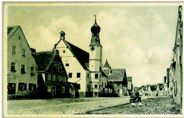
Hauptstraße in Rennertshofen um 1935