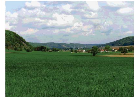
Blick ins Urdonautal