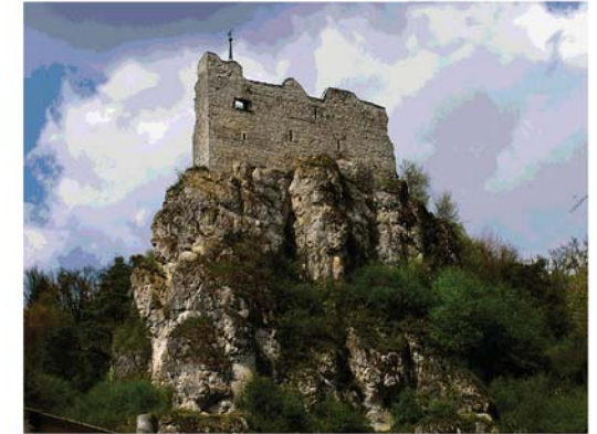
Burgruine in Hütting